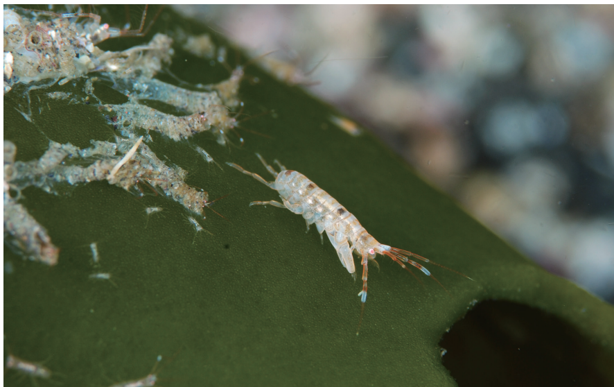
図1 ウスバミルの表面に棲管をつくるホソヨコエビ属の1種 (2014年7月15日撮影)

2020年1月31日から2025年2月28日の間、トゲナシヤギにはセンナリスナギンチャクが共生していたが (図2A)、ホソヨコエビ属は見られなかった。その後、2025年6月11日にホソヨコエビ属の棲管が確認された (図2B)。トゲナシヤギの面積比で約4割を占めており、この時の個体数は観察期間中最大であった。ホソヨコエビ属はトゲナシヤギの海底に近い部分から、骨軸に沿って数千と思われる個体が棲管を作り (図2C・D)、棲管は海底から放射状に広がるように、また骨軸の成長方向に沿うように作られていた (図2E)。小型の棲管や若齢個体も多く含まれ、骨軸上で繁殖が行われていることが推察された (図2F)。棲管の殆どは骨軸に沿って連続して広がっていたが、それと連続しない中央部にも見ることができた (図2G)。トゲナシヤギの一部を採集し営巣部分とそれ以外の部分を実体顕