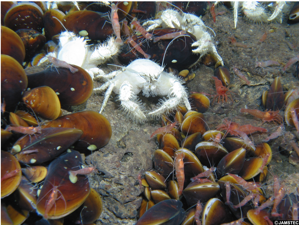
図1 沖縄トラフ南奄西海丘(水深700 m)の熱水噴出域生物群集。ゴエモンコシオリエビ Shinkaia crosnieri やミジラオハラエビ Alvinocaris dissimilis などの節足動物や、シンカイヒバリガイ属 Bathymodiolus やキノミフネカサガイ属 Lepetodrilus の軟体動物が生息。海洋調査船「なつしま」NT11-20次航海、無人探査機「ハイバードルフィン」潜航にて撮影(2011年9月30日; HPD#1327)。

熱水噴出域動物の幼生は、その栄養獲得様式に基づき、卵黄に蓄えられた栄養のみで成長する「卵黄栄養発生」と、海中のプランクトンを摂食して成長する「プランクトン食発生」に大別することができます。これらの栄養獲得様式は、幼生が分散する水深と密接に関連している可能性があります。例えば、卵黄栄養発生を示すゴカイ類では、発生や成長に深海特有の高い