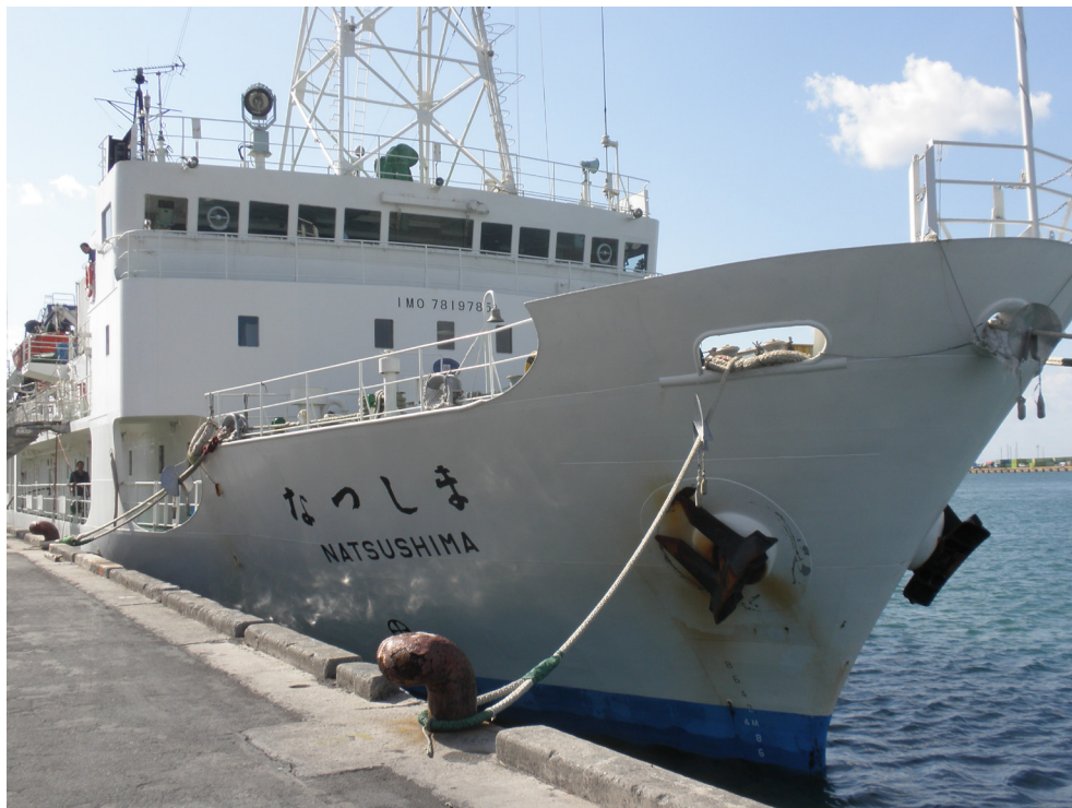
図2 海洋調査船「なつしま」(1981年竣工, 2016年退役)。有人潜水調査船「しんかい2000」や無人探査機「ハイパードルフィン」の母船として活躍。

深海平原や海溝における網羅的な生物調査では底引き網が用いられることが多い一方、熱水噴出域では、限られた範囲での精密な観測と採集が必要となるため、無人探査機や有人潜水調査船が用いられます。無人探査機の海中調査が始まると、搭載されたカメラの映像を船上でリアルタイムに確認することができ、研究者間で相談しながら観測を進めていきます。