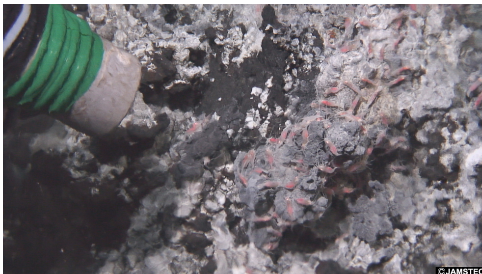
図3 熱水噴出域生物の採集: 無人探査機のスラップガン(左上)を用いてエンセイオハラエビ Rimicaris leurokolos を吸引。海洋調査船「なつしま」NT13-22次航海, 無人探査機「ハイパードルフィン」潜航にて撮影(2013年11月14日; HPD#1593)。